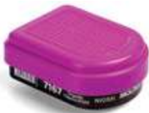
Cartucho Vapores Orgánicos + Filtro P100

Moldex presenta la última innovación en protección respiratoria: el NUEVO Combo de Cartuchos de gas/vapor + Filtro P100 de la serie #7367. La serie Moldex #7367 combina cartuchos y filtros en una unidad totalmente integrada y fácil de colocar, que ofrece máxima comodidad, protección más amplia y comodidad líder en su clase.