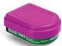
Cartucho Amoniaco / Metilamina + Filtro P100