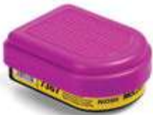
Cartucho Vapores Orgánicos / Gases Ácidos + Filtro P100