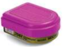
Cartucho Formaldehído + Filtro P100