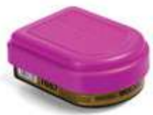
Cartucho Smart Multi-Gas/Vapor + Filtro P100