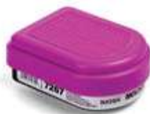
Cartucho Gases Ácidos + Filtro P100