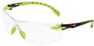
3M™ Solus™ 1201SGAF Scotchgard - Claro