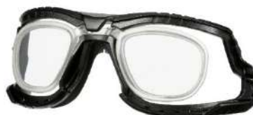
3M™ Inserto de prescripción*