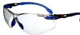
3M™ Solus™ 1107SGAF Scotchgard - In Out