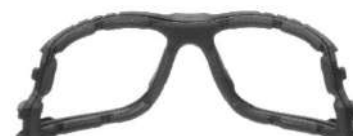
3M™ Marco de espuma*