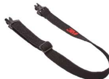
3M™ Banda elástica*