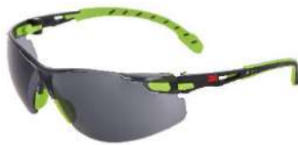
3M™ Solus™ 1202SGAF Scotchgard - Gris