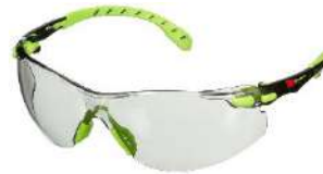
3M™ Solus™ 1207SGAF Scotchgard - In Out

*Dependiendo del país se encuentran disponibles algunos modelos y opciones de lentes que podrían incluir marco de espuma o TPE y banda elástica.