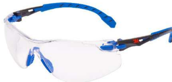
3M™ Solus™ 1000