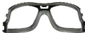
3M™ Marco de TPE*