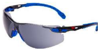
3M™ Solus™ 1102SGAF Scotchgard - Gris