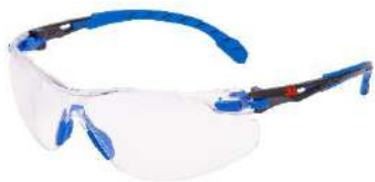
3M™ Solus™ 1101SGAF Scotchgard - Claro